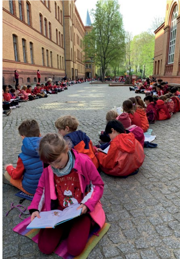
Die Leseschlange der Allegro-Grundschule

Stellvertretend sei hier die Berliner Allegro-Grundschule 15 genannt, die seit Jahren als „lesende Schule“ arbeitet. Sie wird von rund 400 Schüler:innen im Alter von sechs bis zwölf Jahren besucht. Ein Schwerpunkt liegt auf der Vermittlung stabiler Lesefähigkeiten, stets verbunden mit dem Anspruch, Freude am Lesen und an Büchern zu leben und zu wecken. Lesen ist vom Einschulungstag an, bei dem jedes Kind ein Buch geschenkt bekommt, allgegenwärtig: Lesenischen auf den Fluren, Lesepat:innen im Einsatz, Bücher und Ergebnisse der Textarbeit sichtbar ausgestellt, Mitarbeitende präsentieren sich auf Fotos als Leser:innen mit ihrem Lieblingsbuch, selbst Fachräume wie die Mathewerkstatt sind von Literatur begleitet, denn das Lesen findet in allen Fächern statt. In der Leseoase wird wöchentlich ein Bilderbuchkino für kooperierende Kitas präsentiert. Die gut ausgestattete Schulbibliothek mit aktueller, auch mehrsprachiger Kinder- und Jugendliteratur bietet Beratung, Ausleihe, thematische Lesekisten und Familien-Leserollis – Bücherkoffer für Erstleser:innen.